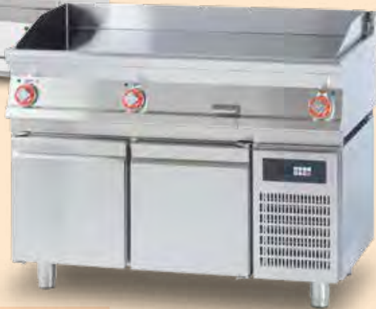
FTLT-712ETS + BRS-121