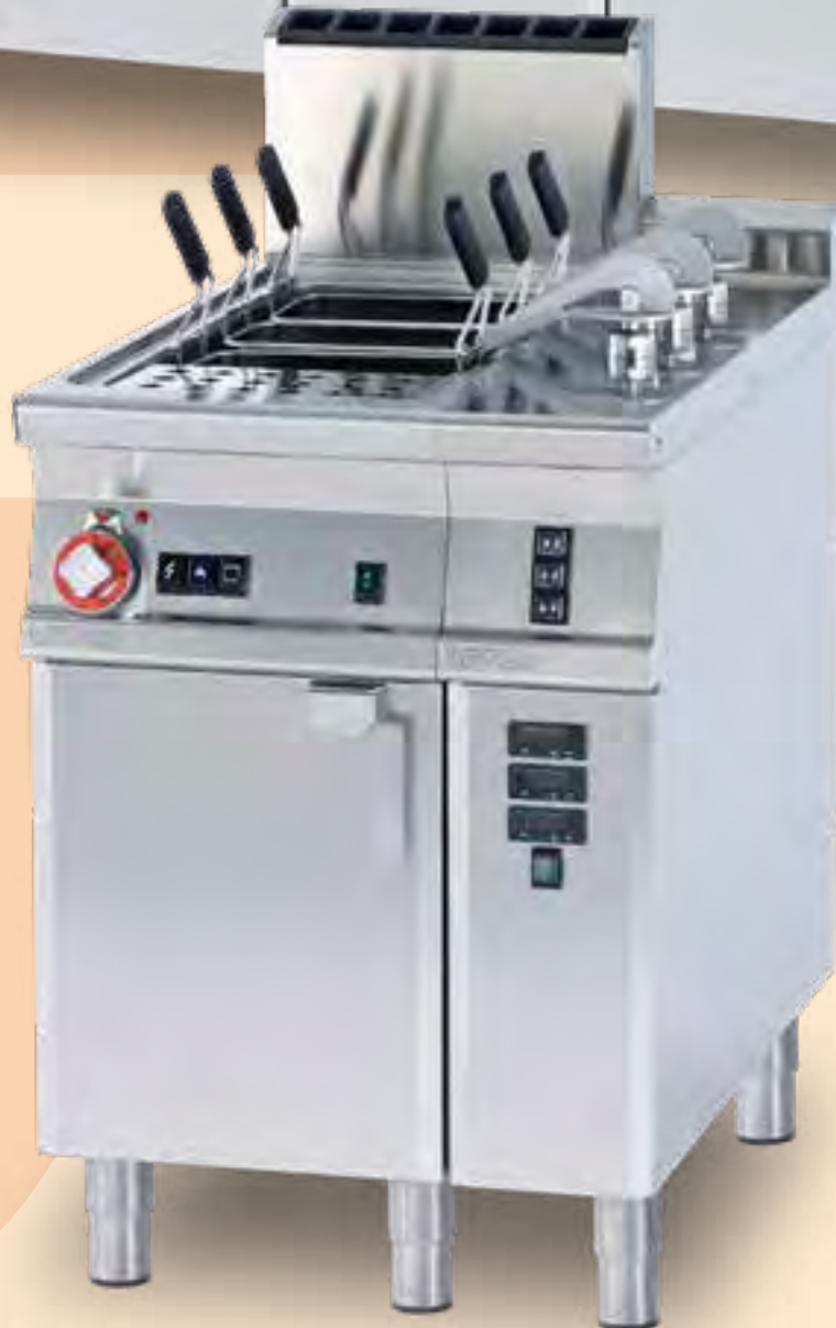
CPPA-94G + SCCP-92EM