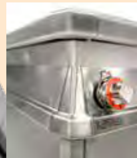
Nuova finitura d'angolo New corner finish Neuer Eckabschluss Nouvelle finition d'angle Nuevo acabado de esquina